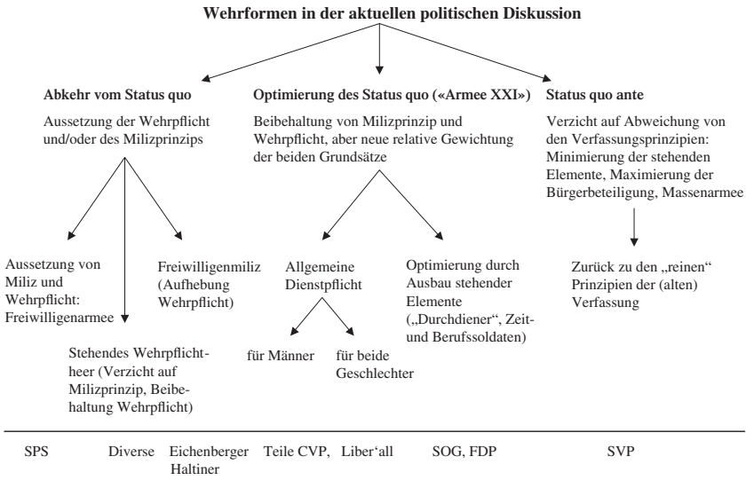
Abbildung 1: Verschiedene Wehrformvorschläge für die Schweiz

schen Aussen- und Sicherheitspolitik und der im Hinblick auf die territoriale Verteidigung veränderten Risikolage Rechnung. Die Freiwilligenmiliz könnte als eine Art Kaderarmee dienen, die sich im Notfall durch Aufwuchs – das heisst die Wiedereinführung der Wehrpflicht – hochfahren liesse. Als Vorteil wird von Anhängern dieser Variante der Entfall des Zwangs und der damit verbundene Motivations- und Produktivitätsgewinn ins Feld geführt. Wie und ob mit materiellen und immateriellen Anreizen genügend Dienstwillige gefunden werden könnten, müsste zweifellos getestet werden. Ohne einen namhaften Kern an Zeit- und Berufssoldaten könnte der Milizsystemen inhärente niedrige Bereitschafts- und Verfügungsgrad wohl kaum kompensiert werden. Bei der Realisierung dieses Vorschlags wäre eine Änderung der Verfassung für die Suspendierung der Wehrpflicht unumgänglich.