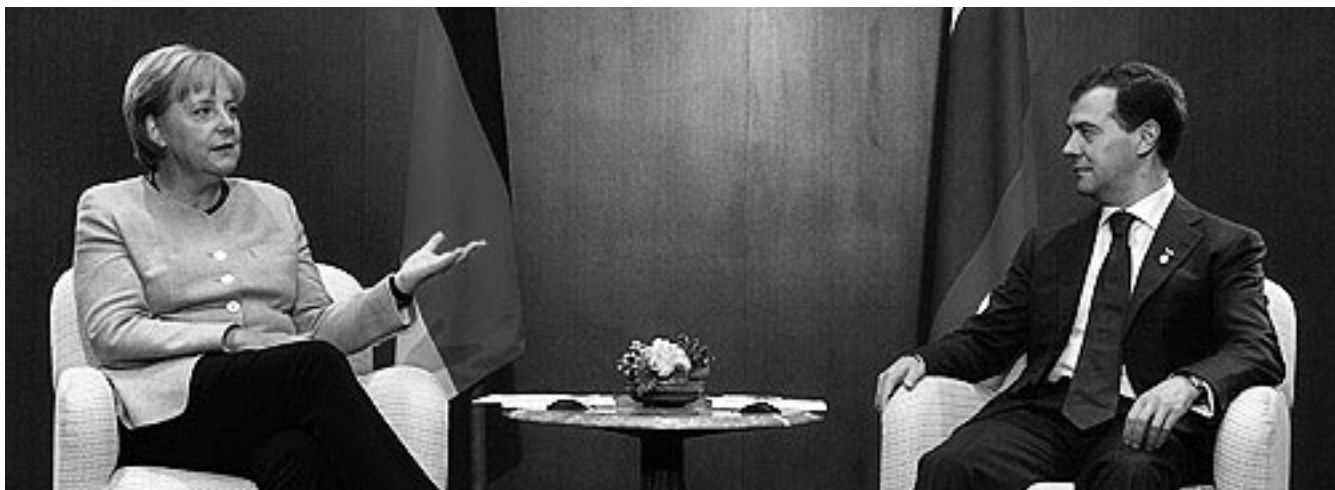
Angela Merkel ja Dmitri Medvedev G8-kokouksessa Italiassa heinäkuussa 2009.