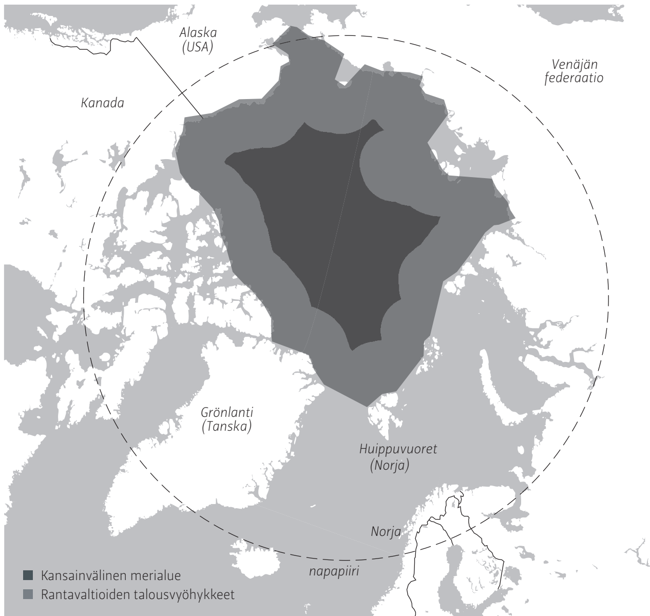
Rantavaltioiden toimintakenttä Jäämerrällä. Kartta: Tuomas Kortteinen

alueella ja Jamalin niemimaalla. Merijään sulaessa Venäjän pohjoispuolella kulkeva Koillisväylä on tulevaisuudessa ratkaisevan tärkeä öljykuljetuksille. Venäjä pyrkiikin siihen, että väylä kulkisi sen aluevesien eikä kansainvälisen merialueen kautta.