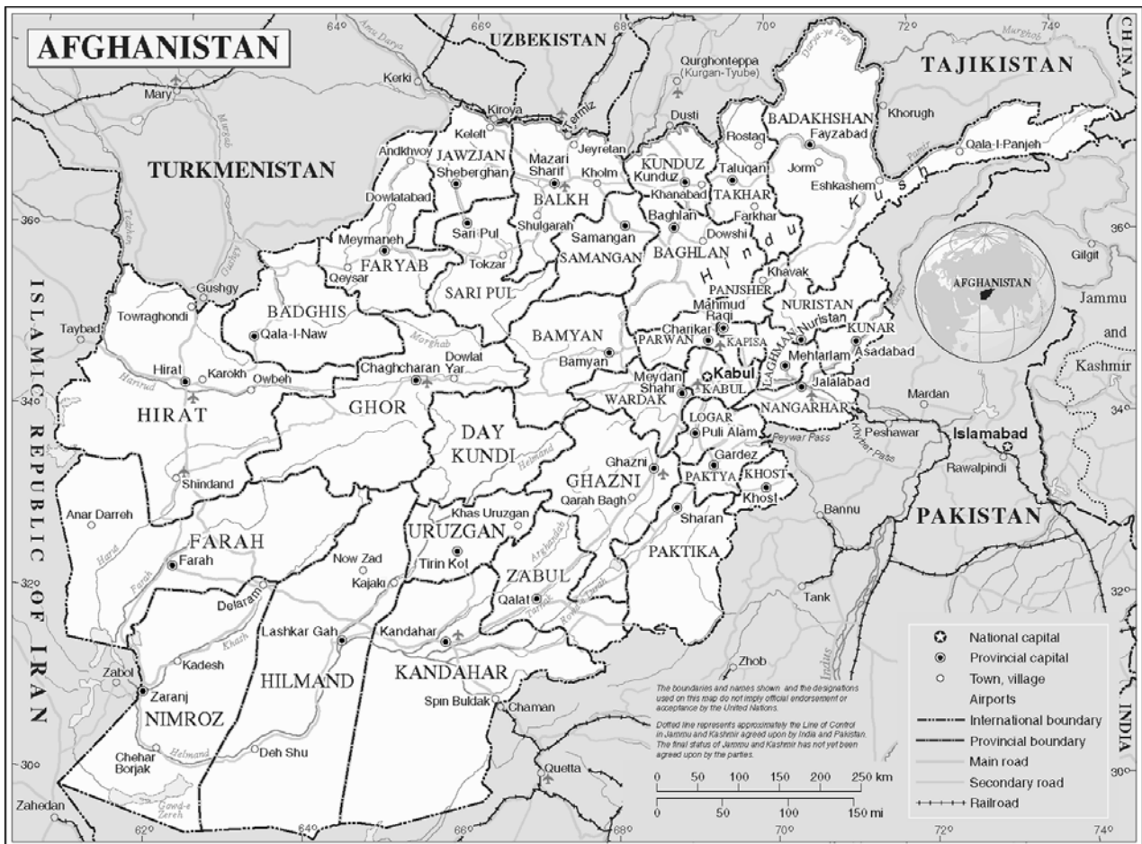
Afghanistan: Provinzen und regionales Umfeld