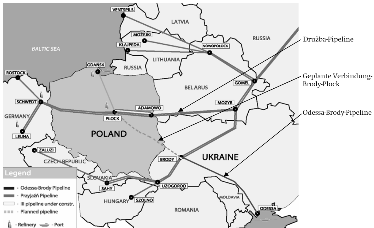
Karte 2 Bestehende und geplante Ölpipelines in und um Polen