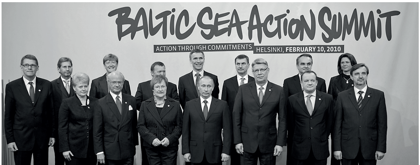
Baltic Sea Action Summit 2010 Helsingissä.

esiin keinoja, joilla sitouttaa poliittiset ja taloudelliset päättäjät entistä tiiviimmin meriympäristön tilan kohentamiseen.