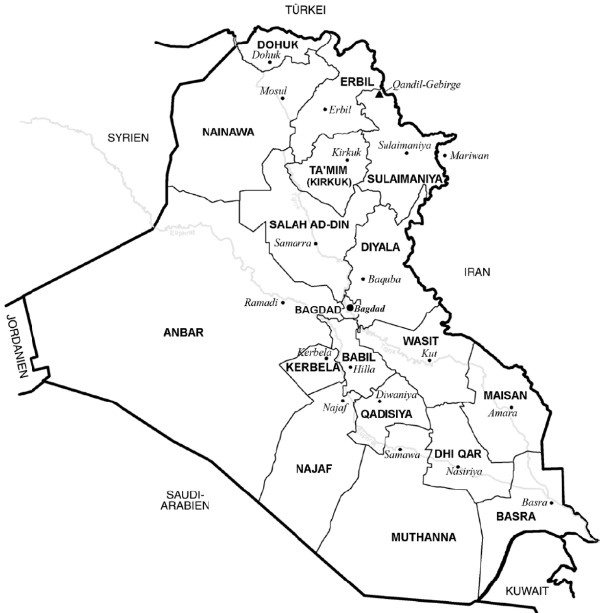
Irak: Provinzen und Provinzhauptstädte

vasion von 2003 bot, und trieben die Konsolidierung des politischen Systems in Irakisch-Kurdistan voran. Die irakisch-kurdische Politik wird bis heute von den beiden Einheitsparteien KDP und PUK dominiert. Sie räumten ihre Zwistigkeiten nach 1998 schrittweise aus und bilden heute ein faktisches Macht-Duopol. Die KDP wird dabei von dem Präsidenten der Kurdenregion, Masud Barzani, und seiner Familie angeführt, die PUK vom irakischen Präsidenten Jalal Talabani. Beide Parteien herrschen durchaus autoritär über die