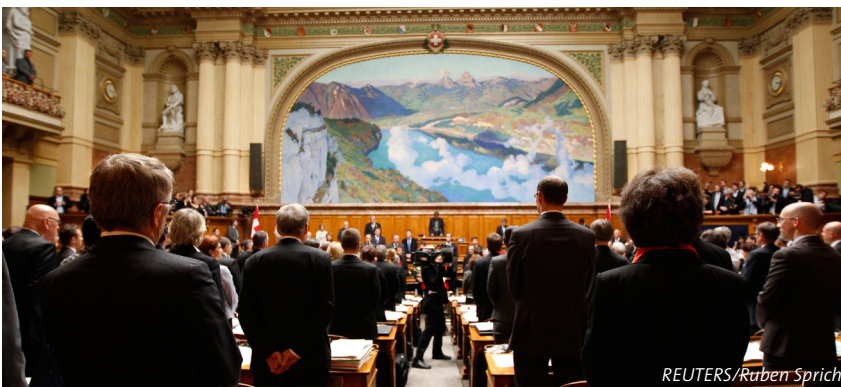
Auch das neu konstituierte Parlament wird in aussenpolitischen Fragen gefordert sein (5. Dezember 2011).

Die Schweizer Aussenpolitik hat in der Ära Calmy-Rey an Dynamik gewonnen. Der Spielraum für ein eigenständiges aussenpolitisches Profil ist in den letzten Jahren allerdings kleiner geworden. Die Europapolitik gleicht heute einer Grossbaustelle. Mit Blick auf die grossen anstehenden Herausforderungen erscheinen eine stärkere Fokussierung des Aussennetzes und Massnahmen zur Verbesserung der aussenpolitischen Kohärenz prüfenswert. Notwendig sind auch weitere Anstrengungen zur innenpolitischen Verankerung der Friedenspolitik.