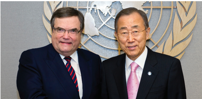
Vor einer schwierigen Aufgabe: Der Finne Jaakko Laajava (hier mit Ban Ki Moon) soll die für 2012 geplante Nahost-Konferenz moderieren. New York, 27. Oktober 2011.

Derzeit wird die Schaffung einer massenvernichtungswaffenfreien Zone im Nahen Osten diskutiert. Kurzfristige und strukturelle Rahmenbedingungen lassen eine baldige Realisierung jedoch unwahrscheinlich erscheinen. Eine Lösung im Atomstreit mit Iran ist nicht in Sicht. Für Israel scheint eine nukleare Abrüstung weder notwendig noch erstrebenswert. Und die politischen Umwälzungen behindern Abrüstungsschritte eher, als dass sie sie fördern. Es dürfte schon schwierig sein, in der Region den nuklearen Status quo aufrechtzuerhalten.