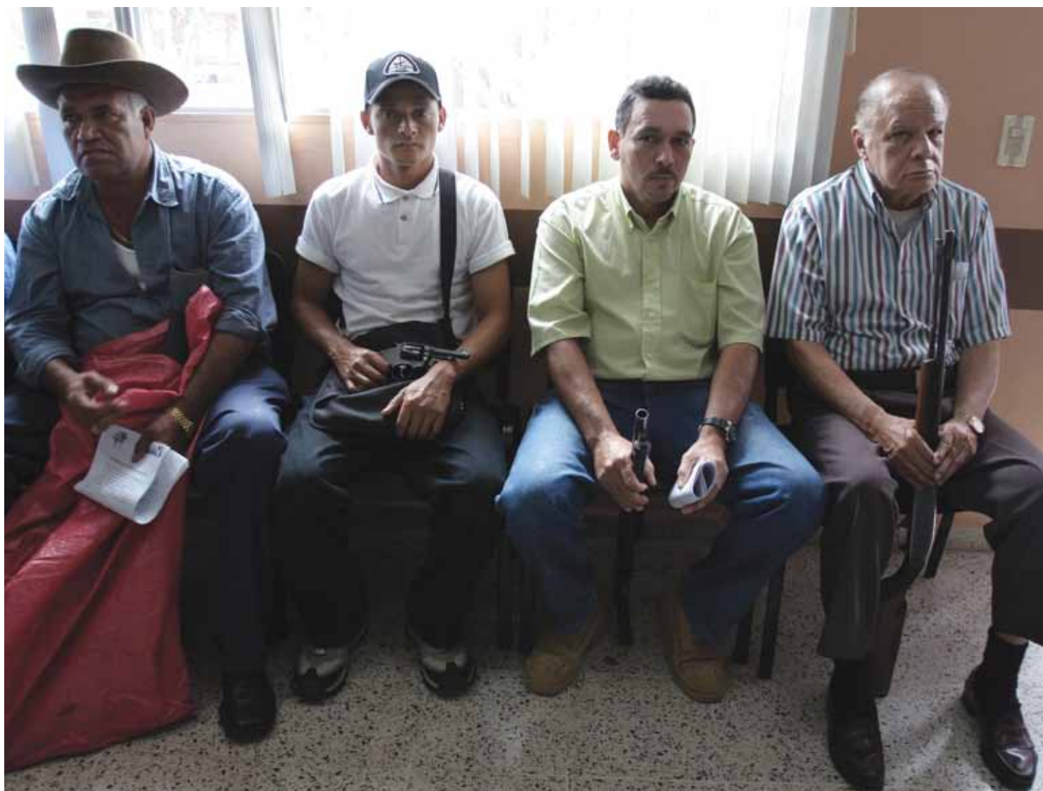
Persones fent cua per inscriure les seves armes de foc al Registre Balístic de Tegucigalpa, Hondures, durant el darrer dia habilitat per fer-ho, agost del 2005. Segons la Direcció General d'Investigacions Criminals (DGIC), a Hondures hi ha 140.000 armes registrades.

Per regla general, els observadors volen saber no tan sols quantes armes en mans de civils hi ha en un país, sinó també si el total s'està incrementant i en quina proporció. En alguns casos, el registre, o les dades sobre producció i comerç, poden permetre aquesta avaluació longitudinal, per bé que exclusivament per a les armes legals.