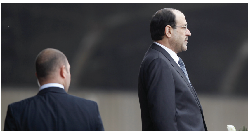
Avec son style de gouvernement autoritaire, le Premier ministre chiite al-Maliki s'est attiré les foudres des sunnites et des Kurdes. Bagdad, 6 janvier 2012

Les Etats-Unis n'ont guère pu masquer lors de leur retrait d'Irak fin 2011 que leur politique irakienne a échoué et qu'ils laissent derrière eux un pays instable. Dans l'accentuation des clivages confessionnels et ethniques que l'on peut observer en Irak depuis plusieurs mois, il faut cependant voir aussi la défaillance de la politique à Bagdad. Une nouvelle explosion de violence n'est plus à exclure, d'autant que les rapports tendus entre l'Iran et les monarchies sunnites du Golfe ainsi que la Turquie encouragent en Irak des tendances centrifuges. Les crises en Syrie et en Irak s'entrecroisent ici de plus en plus.