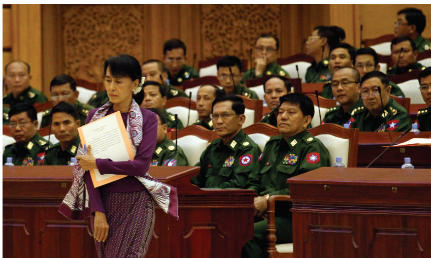
La cheffe de l'opposition Aung San Suu Kyi prête serment sur la Constitution du Myanmar – qu'elle critique – au parlement, le 2 mai 2012.

Après des décennies de dictature militaire, le Myanmar connaît depuis quelque temps un remarquable changement en politique intérieure. Le déroulement du processus de réforme est cependant largement contrôlé par les dirigeants militaires et c'est pourquoi une démocratisation s'assortit de limites pour le moment. Une course internationale à l'influence et à l'accès aux ressources naturelles du Myanmar a été engagée après l'ouverture du pays et sa libération de l'emprise chinoise. Mais les Etats occidentaux feraient bien de ne relâcher leurs sanctions que graduellement et de manière limitée dans le temps.