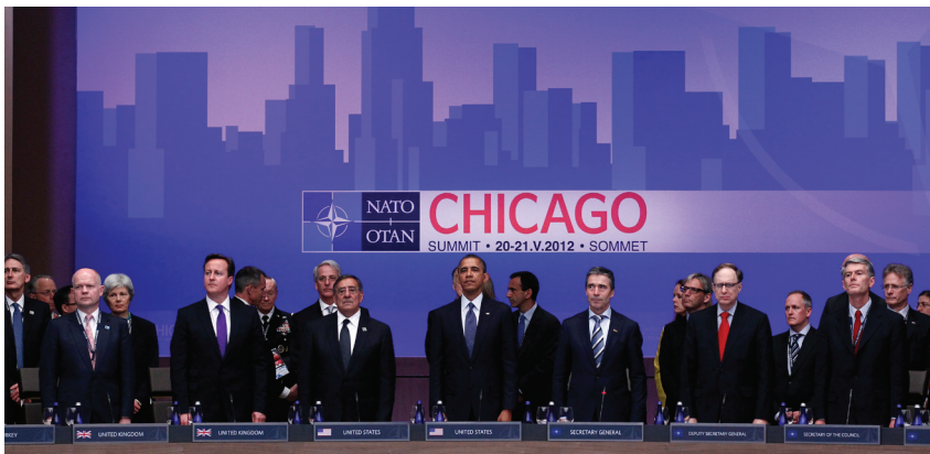
Schweigeminute am NATO-Gipfel in Chicago, 20. Mai 2012.

Der NATO-Gipfel in Chicago drehte sich um Fragen der Verteidigungsfähigkeit und der Afghanistanpolitik. Die Idee von Smart Defence als Antwort auf schrumpfende Verteidigungsbudgets ist zwar bestechend, ihre Umsetzung bleibt aber schwierig. Bezüglich Nuklearstrategie und Raketenabwehr demonstrierte das Bündnis Einigkeit, ohne dass die politischen Kontroversen in diesen Themenbereichen entschärft worden wären. Angesichts der wachsenden Interventionsmüdigkeit droht der Allianz nach der ISAF-Operation eine Orientierungskrise – mit Folgen auch für Partnerstaaten wie die Schweiz.