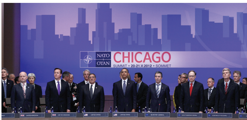
Minute de silence au sommet de l'OTAN à Chicago, le 20 mai 2012.

Le sommet de l'OTAN à Chicago a tourné autour des questions de capacité de défense et de la politique afghane. L'idée d'une «Défense Intelligente» en réponse à la baisse des budgets est certes séduisante, mais sa réalisation reste difficile. En ce qui concerne la stratégie nucléaire et la défense antimissile, l'Alliance a fait preuve d'unité sans désamorcer pour autant les controverses politiques dans ces domaines. Etant donné la «fatigue des opérations» croissante, une crise d'orientation – aussi assortie de conséquences pour les Etats partenaires comme la Suisse – menace l'Alliance après la mission ISAF.