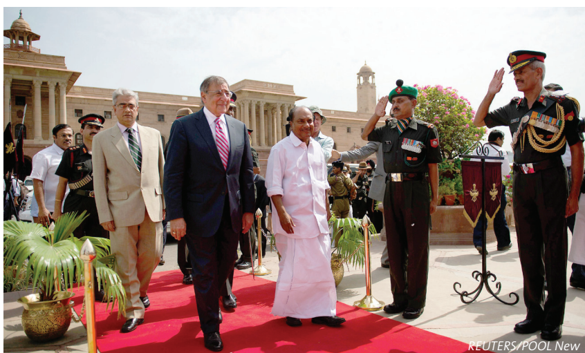
M. Panetta, le ministre américain de la Défense, et son homologue indien, M. Antony, à New Delhi le 6 juin 2012

Les relations entre l'Inde et les Etats-Unis se sont beaucoup améliorées ces dernières années. Un partenariat stratégique complet ne s'esquisse cependant pas malgré les avances américaines. Des divergences intrinsèques et des priorités différentes ne permettent qu'une coopération sélective. L'Inde restera un facteur d'insécurité stratégique dans le dispositif sécuritaire indopacifique des Etats-Unis à tout le moins tant que sa rivalité avec la Chine ne tourne pas à la confrontation.