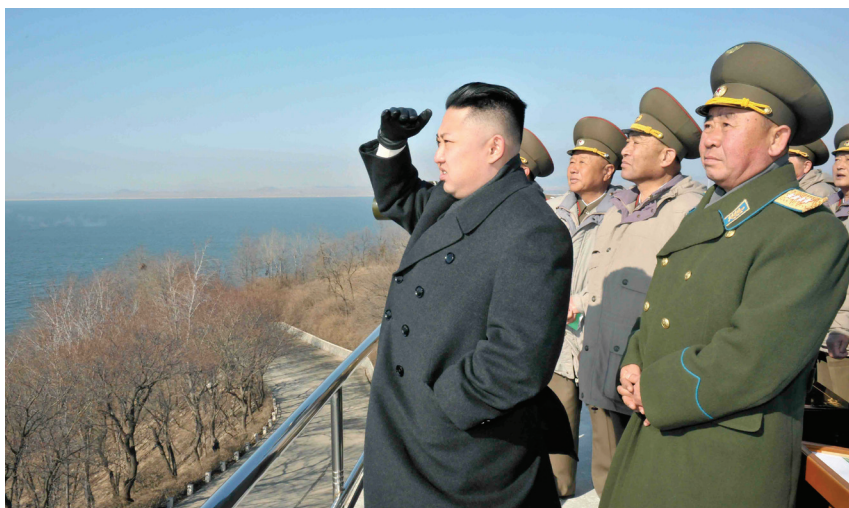
Peu de nouvelles perspectives dans le conflit autour du programme atomique nord-coréen: Kim Jong-Un passe en revue les forces armées nord-coréennes, le 15 mars 2012.

Depuis environ deux décennies, de nombreux acteurs internationaux dans différentes constellations avec la Corée du Nord se battent pour résoudre le conflit nucléaire latent. De brèves phases de rapprochement politique alternent avec des confrontations diplomatiques et militaires. La prise de pouvoir de Kim Jong-Un en décembre 2011 n'a, jusqu'à présent, rien changé à ce schéma. C'est pourquoi les acteurs internationaux devront décider s'ils veulent poursuivre la politique d'endiguement ou reprendre les négociations multilatérales.