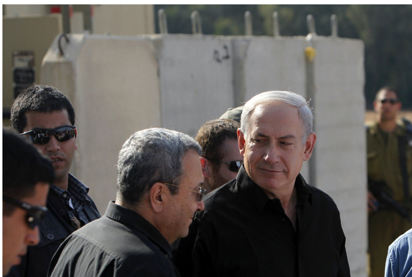
Netanyahu, le Premier ministre, et Barak, le ministre de la Défense, visitent le poste de commandement du système de défense antimissile Iron Dome, le 24 octobre 2012.

Israël a été dès le début très sceptique quant aux bouleversements dans le monde arabe. La grande majorité de l'élite politique israélienne s'attend à ce que la montée des islamistes, les nouveaux espaces libres pour les terroristes et le rôle changeant des Etats-Unis dans la région aient des répercussions négatives sur la sécurité d'Israël. Les avis des Israéliens sont partagés quant à la manière dont le pays doit réagir à son voisinage en mutation. La ligne de cloisonnement en politique étrangère et de dissuasion militaire de Netanyahu rencontre cependant un grand soutien.