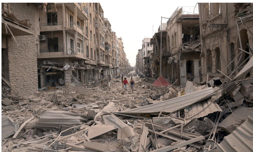
Rue détruite par la guerre à Alep, le 3 octobre 2012

Les chances que la guerre civile en Syrie soit réglée diplomatiquement sont plus faibles que jamais. Il faut s'attendre à une poursuite de l'escalade de la violence, même si tous les scénarios n'impliquent pas une guerre d'usure sur le long terme. Une intervention militaire occidentale ne s'amorce pas, étant donné la division de l'ONU et les risques élevés de ce type de mission. Le conflit syrien devient cependant de plus en plus une guerre par procuration régionale dont le dénouement aura des implications énormes pour les rapports de force au Proche-Orient.