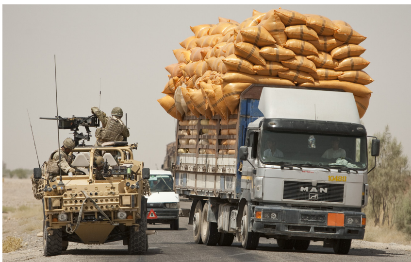
La coordination interdépartementale d'activités gouvernementales représente un grand défi: troupes britanniques à Helmand, Afghanistan, juillet 2011.

Suite à la complexité croissante du domaine de la politique extérieure, le besoin de coordination a fortement augmenté. L'approche pangouvernementale (« Whole of Government Approach », WGA) offre des possibilités de renforcer la coopération entre les unités administratives d'un Etat. Idéalement, elle accroît l'efficacité et la cohérence des activités gouvernementales. Ces efforts de coordination intensifiés exigent cependant du temps et des ressources et peuvent parfois supplanter les objectifs de mise en œuvre proprement dits. C'est pourquoi une application différenciée de l'approche est indiquée.