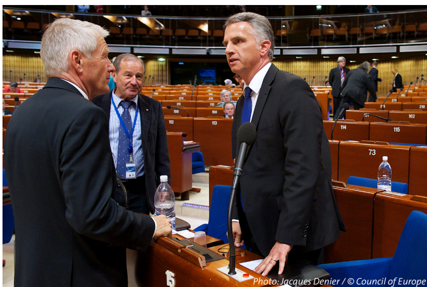
La Suisse a adhéré au Conseil de l'Europe il y a cinquante ans: M. Didier Burkhalter, Conseiller fédéral (d.), s'entretenant avec le Secrétaire général du Conseil de l'Europe, M. Thorbjørn Jagland (g.). Strasbourg, le 23 avril 2013.

La Suisse fête le cinquantième anniversaire de son adhésion au Conseil de l'Europe. Cette organisation apporte une valeur ajoutée essentielle, en particulier dans le domaine des droits de l'homme. Les critiques reprochent simultanément au Conseil de l'Europe de n'être pas suffisamment efficace, d'être trop dispersé et de présenter trop de redondances avec d'autres organisations internationales. Le Conseil de l'Europe et son fleuron, la Cour européenne des droits de l'homme, subissent des réformes depuis 2010. L'importance que continuera de revêtir le Conseil de l'Europe pour l'Europe et la Suisse dépend du succès de ces réformes.