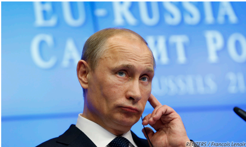
Spannungsreiche Beziehungen: Vladimir Putin am EU-Russland-Gipfel in Brüssel, 21. Dezember 2012.

Während die wirtschaftliche Bedeutung Russlands in Europa in den letzten Jahren zugenommen hat, haben sich die politischen Beziehungen verschlechtert. Russland hegt unter Putin wieder verstärkt Grossmachtambitionen und vertritt zunehmend Interessen und Werte, die sich von denjenigen des Westens unterscheiden. Die Hoffnungen auf eine postimperiale und demokratische Identität Russlands haben sich stark eingetrübt. Europa und die USA sollten versuchen, ihre Interessen durch eine Kombination von Kooperation und strategischem Wettbewerb zu wahren.