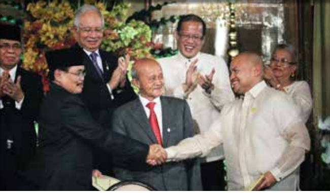
رئيسا طاولتا السلام بين الحكومة الفلبينية (مارفريك ليونين على اليمين) وجبهة تحرير مورو الإسلامية (مغفر إقبال على يمين ومهاجر على اليسار) يتصافحان بعد التوقيع، 15 أكتوبر 2012.

الآونة الأخيرة، ظهرت خمسة وسيطات من الإنث من سولو في منشور مركز الحوار الإنساني المعنون صنع السلام بأيديهم. في عام 2012، قدم مركز الحوار الإنساني الدعم أيضاً لثلاث مناقشات مائدة مستديرة أدارتها مجموعة مناصرة لحقوق المرأة المسلمة، وهي نساء الحق في بانجسامورو، والتي ركزت على تعزيز إيلاء الاعتبار لحقوق المرأة وقضايا النوع الاجتماعي في عملية السلام الوطنية وساعدت النساء من كل جانب على حد سواء.