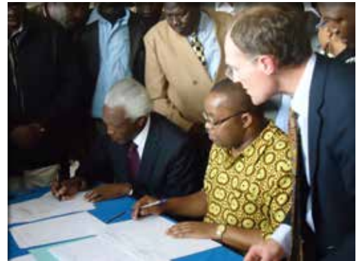
التوقيع على "اتفاق سلام مقاطعة ناكورو"، 19 أغسطس/آب 2012.

لم يشهد مركز الحوار الإنساني عملية التوقيع الفريدة من نوعها هذه فحسب بل بدأت المنظمة بالفعل دعم عملية تنفيذ الإتفاق المهمة حقاً في مقاطعة ناكورو والنظر في السبل التي تمكنها من تكرار هذا النجاح في مناطق أخرى من كينيا. ومنذ التوقيع على الإتفاق، كان كل من لجنة التماسك والتكامل الوطني الكيني ومركز الحوار الإنساني، ولا يزال، يعمل على ضمان أن يساهم إتفاق السلام لمقاطعة ناكورو في منع العنف، وتعزيز السلام وأن يقدم نموذجاً يحتذى للمجتمعات المحلية الأخرى في كينيا.