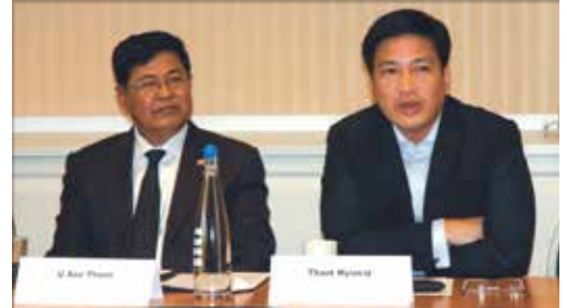
وزير الصناعة ميانمار، يو سو نين (على اليسار)، والمؤرخ والكاتب، ثانت مينت-بو (على اليمين).