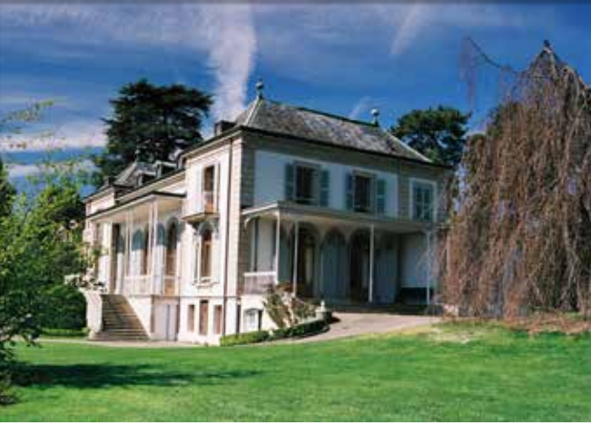
فيلا بلانتامور، مقر مركز الحوار الإنساني

التي تستضيف المقر الأوروبي للأمم المتحدة، مركزاً للجهات الفاعلة الإنسانية وصانعي السلام في جميع أنحاء العالم. ويوفر المقر الرئيسي لمركز الحوار الإنساني في فيلا بلانتامور، التي تكرمت بلدية جنيف بإعارتها للمنظمة - بعيداً عن الضغوط المباشرة للمجتمعات المحلية والبلدان التي تمر بصراع - مكاناً هادئاً لجمع الأطراف المتنازعة والعمل معاً على حل المشاكل من خلال الحوار.