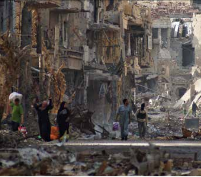
السكان همشون على طول شارع تصطف به مباني مدمرة، دير الزور، أبريل/نيسان 2013.

الخلفيات والانتماآت السياسية، فضلاً عن الأطراف المعنية من مختلف المناطق والفئات العرقية والمجتمعات المحلية بغية إيجاد حلول مقبولة لدى تلك الأطراف بشأن القضايا السياسية التي تواجه البلاد.