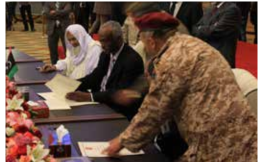
التوقيع على اتفاق سلام سيها من طرف شيوخ سيها، 20 أبريل/نيسان 2013.

ولا تزال القضايا المحيطة بالتحول الديمقراطي في ليبيا تسبب إنقساماً كبيراً في البلاد، ولا سيما قضايا التطهير، وتوزيع المقاعد الانتخابية، وتشكيل الجمعية التأسيسية التي ستكون مسؤولة عن صياغة الدستور. وقد أسفرت التوترات عن إشتباكات وإعتداءات عنيفة على المؤسسات الديمقراطية الوليدة في ليبيا. وبغية إقامة حوار بين المجتمعات المحلية في جميع أنحاء البلاد، عقد مركز الحوار الإنساني في عام 2012 ثلاثة عشر حلقة عمل داخلية وحلقتي عمل وطنية تناولت الشواغل الرئيسية لدى الليبيين خلال هذه الفترة الانتقالية. وقد شارك في حلقات العمل هذه أكثر من 450 ليبيا من أكثر من 30 بلدة ومدينة في حوار بناء حول مجالات معينة مثل العملية الانتخابية والدستورية والمصالحة والأمن والصراعات المحلية. ويهدف عمل مركز الحوار الإنساني في ليبيا إلى الجمع بين الأطراف المعنية الليبية من مختلف