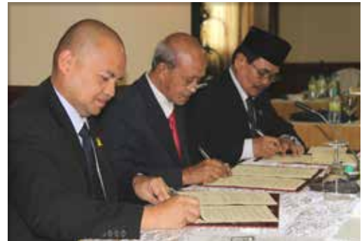
توقيع إعلان المبادئ بين الحكومة الفلبينية وجبهة تحرير مورو الإسلامية، 24 أبريل/نيسان 2012.

كما قدم مركز الحوار الإنساني الدعم أيضاً للجهود الرامية إلى تعزيز دور المرأة، وإثارة الشواغل الجنسية، في صنع السلام في الفلبين. وفي