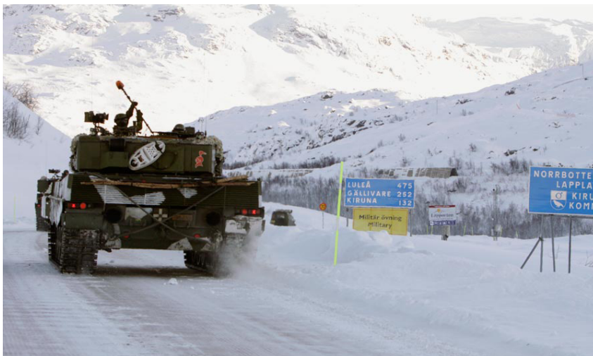
Während der Nato-Militärübung «Cold Response 2010» rollen norwegische Panzer über die Grenze nach Schweden.

In Schweden wird heftig über die Verteidigungspolitik debattiert. Seine Armee könne das Land nur eine Woche gegen einen Angreifer verteidigen, beklagt sich der schwedische Oberbefehlshaber. Aus Angst vor Russland wird die Territorialverteidigung wieder ein Thema, nachdem die schwedische Armee sich stark auf Auslandseinsätze ausgerichtet hatte. Kritiker bezweifeln, ob Schweden sich im Kriegsfall überhaupt noch selbst verteidigen könnte. Das führt zu Diskussionen über kollektive Verteidigung und Beistandspflicht – obwohl Schweden an der militärischen Allianzfreiheit festhält.