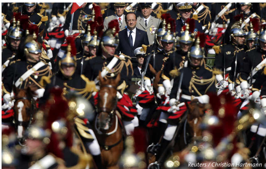
Le président français, François Hollande, lors de la parade militaire traditionnelle du 14 juillet 2013 à Paris.

On attendait avec impatience le Livre blanc sur la défense et la sécurité nationale français publié récemment. L'UE est en effet en train de repenser ce domaine politique. Etant donné le budget militaire en baisse et les capacités militaires réduites, la France, la principale puissance militaire sur le continent européen, est forcée de revoir ses ambitions à la baisse. Paris veut accélérer par la même occasion les efforts de sécurité et de défense européenne commune.