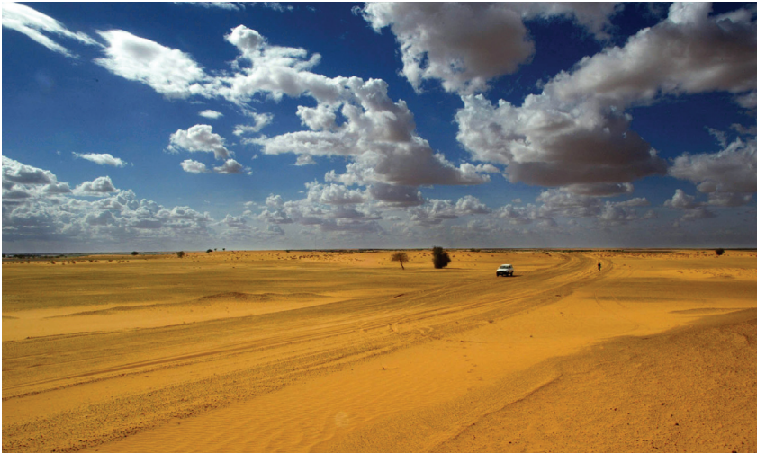
Touristen am Rande der Sahara-Wüste in Forgo im Norden Malis.

In den letzten Jahren haben Entführungen mit Lösegeldforderungen weltweit zugenommen. Gerade für islamistische Terrorgruppen in der Sahelzone ist das Kidnapping inzwischen zu einer lukrativen Einnahmequelle geworden. Die Schweiz arbeitet an vorderster Front mit, um einen einheitlichen Verhaltenskodex im Umgang mit «Kidnapping for Ransom» (KFR) global durchzusetzen. KFR ist auch ein Thema im Schweizer OSZE-Vorsitzjahr 2014.