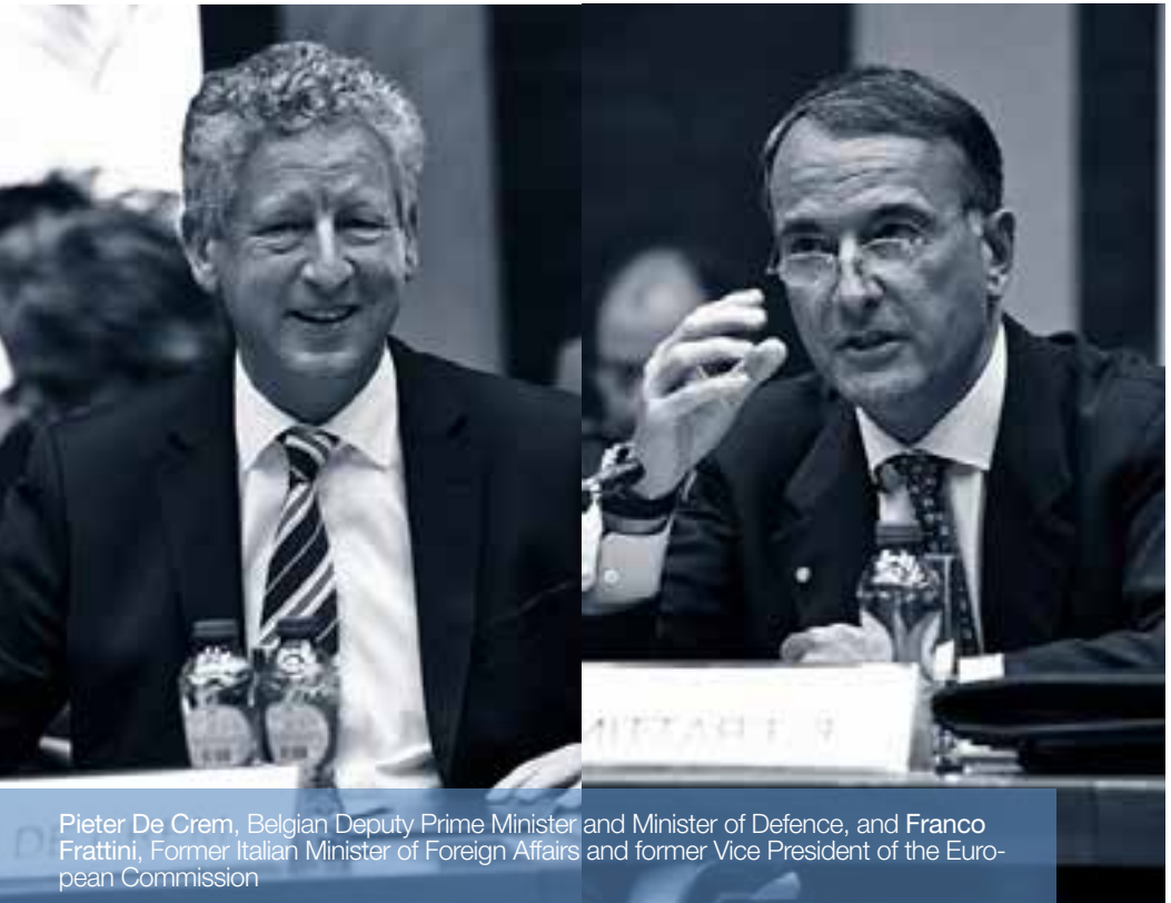
Pieter De Crem, Belgian Deputy Prime Minister and Minister of Defence, and Franco Frattini, Former Italian Minister of Foreign Affairs and former Vice President of the European Commission

"The European countries are showing difficulties in realising anything concrete in the run up to the European Council in December," De Crem cautioned. "The Union should stand more firmly on its own two feet and do more, especially in the area of security and defence."