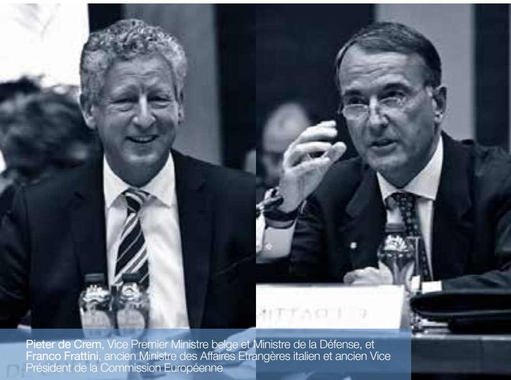
Pieter de Crem, Vice Premier Ministre belge et Ministre de la Défense, et Franco Frattini, ancien Ministre des Affaires Etrangères italien et ancien Vice Président de la Commission Européenne

Il nous met en garde sur le fait que « les pays européens ont du mal à accomplir quoi que ce soit de concret en prévision du Conseil européen de décembre.