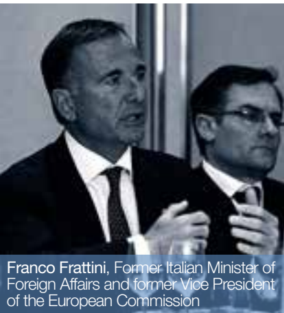
Franco Frattini, Former Italian Minister of Foreign Affairs and former Vice President of the European Commission