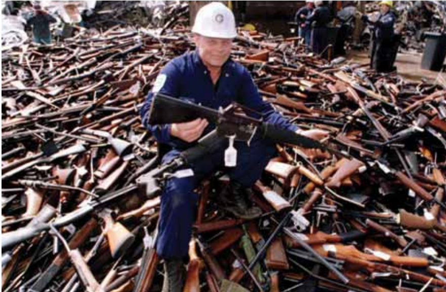
Australie, Melbourne. Un employé d'une société de sécurité montre les armes remises à des fins de destruction après l'introduction de la loi interdisant la détention de fusils automatiques et semi-automatiques par la population civile.

en œuvre, mais, en l'état actuel des choses, le Brésil a incontestablement réussi à réduire substantiellement le nombre d'homicides commis sur son territoire, particulièrement celui des homicides par balle, depuis l'entrée en vigueur du Statut en 2003.