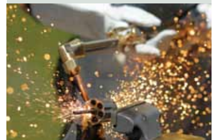
Salvador. Un soldat détruit la chambre d'un pistolet à la torche à souder en septembre 2012, dans le cadre d'un programme qui a permis à l'armée de détruire plus de 800 armes et des milliers de cartouches de munitions remises par des gangs.