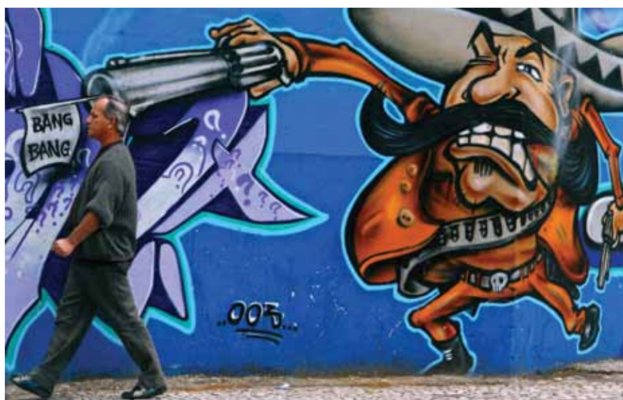
Brésil, Sao Paulo. Un Graffiti dans le centre-ville de Sao Paulo pendant un programme national de rachat d'armes en juillet 2004.

Dans les zones non conflictuelles, l'efficacité des programmes de collecte et de saisie d'armes est subordonnée à leur intégration à des initiatives plus globales visant à réduire la demande et à rendre plus difficile l'accès aux armes de substitution. Dans le cas des armes légalement détenues, les campagnes de collecte et les autres types de mesures de