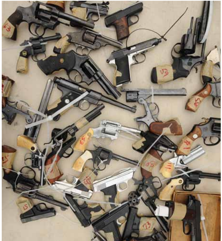
États-Unis, Los Angeles : armes à feu volontairement remises à la police sur une durée de cinq heures le 9 mai 2009. Dans le cadre d'un programme de rachat d'armes d'une journée, les citoyens ont reçu des bons d'achat valables dans un supermarché local en échange des armes restituées.

Les stratégies de désarmement sont fondées sur l'idée qu'en restreignant l'accès aux armes mortelles, il est possible de réduire le nombre d'homicides et de blessures dues à ces armes. Une étude de l'Organisation de Coopération et de Développement Économiques (OCDE), publiée en 2011 et portant sur 570 interventions de RPVA 4 publiques ou émanant de la société civile, a par exemple montré que 90 % des interventions directes étaient des programmes de désarmement qui supposaient le retrait physique