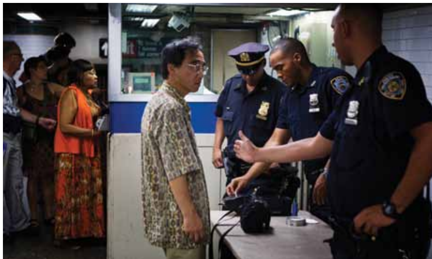
États-Unis, New York. En août 2011, des officiers de police effectuent un contrôle aléatoire des sacs à l'entrée du métro.

L'insécurité perçue et le besoin connexe de protection apparaissent également comme des facteurs déterminants de la possession d'armes dans d'autres contextes géographiques. Au Kenya, au Soudan du Sud et au Somaliland, des enquêtes sur les ménages ont montré que les personnes interrogées considéraient la sécurité personnelle et la protection de leur village ou de leurs biens comme la principale justification de leur décision de posséder une arme (Pavesi, 2013). Les personnes interrogées lors d'une enquête récente menée en Libye ont expliqué le fait qu'ils détiennent des armes à feu en invoquant trois raisons principales : leur volonté d'assurer leur propre protection contre les gangs et les criminels, la crainte d'un conflit à venir et la peur de l'instabilité qui règne dans le pays, et enfin la protection de leurs biens (Gallup, 2013).