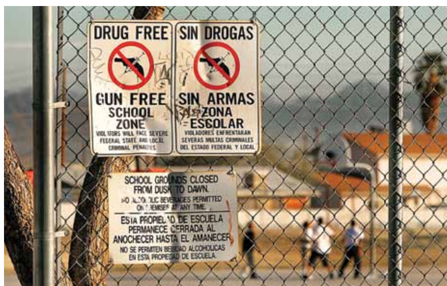
États-Unis, Arizona. En décembre 2004, des panneaux affichés dans une école élémentaire de Phoenix signalent une zone scolaire où la drogue et les armes sont interdites.

En 1993, les trois plus grandes villes de Colombie, Bogotá, Medellín, et Cali, abritaient 23 % de la population et 31 % des homicides y étaient commis. Sous réserve de l'obtention d'un permis délivré par l'armée, les civils étaient autorisés à porter une arme à feu dissimulée dans les lieux publics (Villaveces, 2000, p. 1205). Les villes de Cali (en 1993 et 1994) et de Bogotá (de 1995 à 1997) ont institué une interdiction du port d'armes dont la particularité était d'être limitée à certaines périodes de l'année particulièrement propices à la violence, notamment les week-ends suivant les jours de paie, les jours fériés et les journées électorales (Villaveces, 2000, p. 1206). À Cali, l'analyse des résultats sur la période concernée a montré que le nombre d'homicides diminuait nettement durant