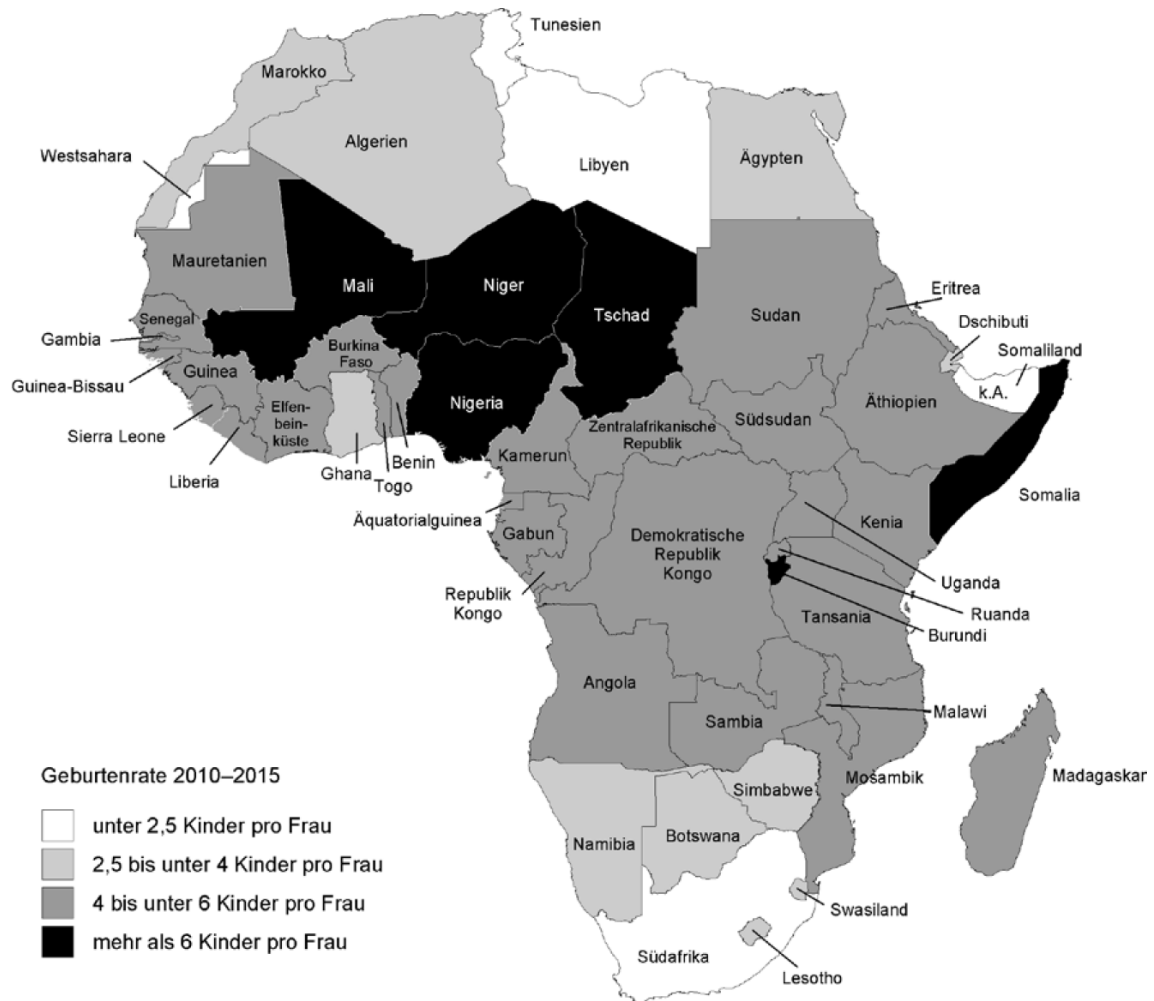
Abbildung 1 Prognostizierte Geburtenraten in Afrika 2010–2015