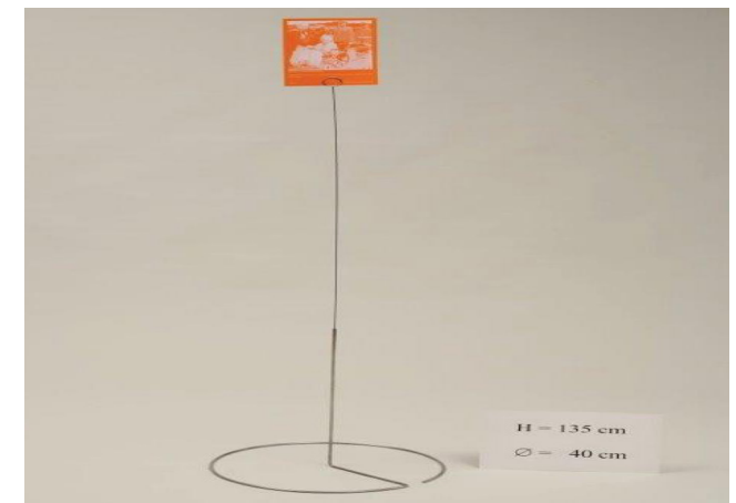
Ausstellung „1000 Gesichter des Friedens“