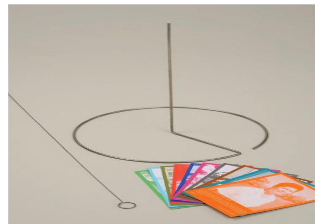
Ausstellung „1000 Gesichter des Friedens“

bei KOFF geführt. Den swisspeace-MitarbeiterInnen, die nicht bei KOFF angestellt waren und sich nicht spezifisch für das Thema interessierten, war der Stellenwert von Gender für konfliktbezogene Arbeit und die von KOFF entwickelten Methoden für gendersensitive Friedensförderung kaum bekannt. Es gab auch wenig organisatorische Bemühungen, die Erkenntnisse der Genderarbeit im Bereich der zivilen Friedensförderung in die thematischen Bereiche von swisspeace zu transferieren. Somit hatte swisspeace sich der Verantwortung für dieses Thema bis zu einem gewissen Grad entzogen: die Friedensstiftung hatte das Thema bei KOFF untergebracht, hatte dessen kritisches Potential und Anlage als bereicherndes Querschnittsthema aber nicht ausgeschöpft.