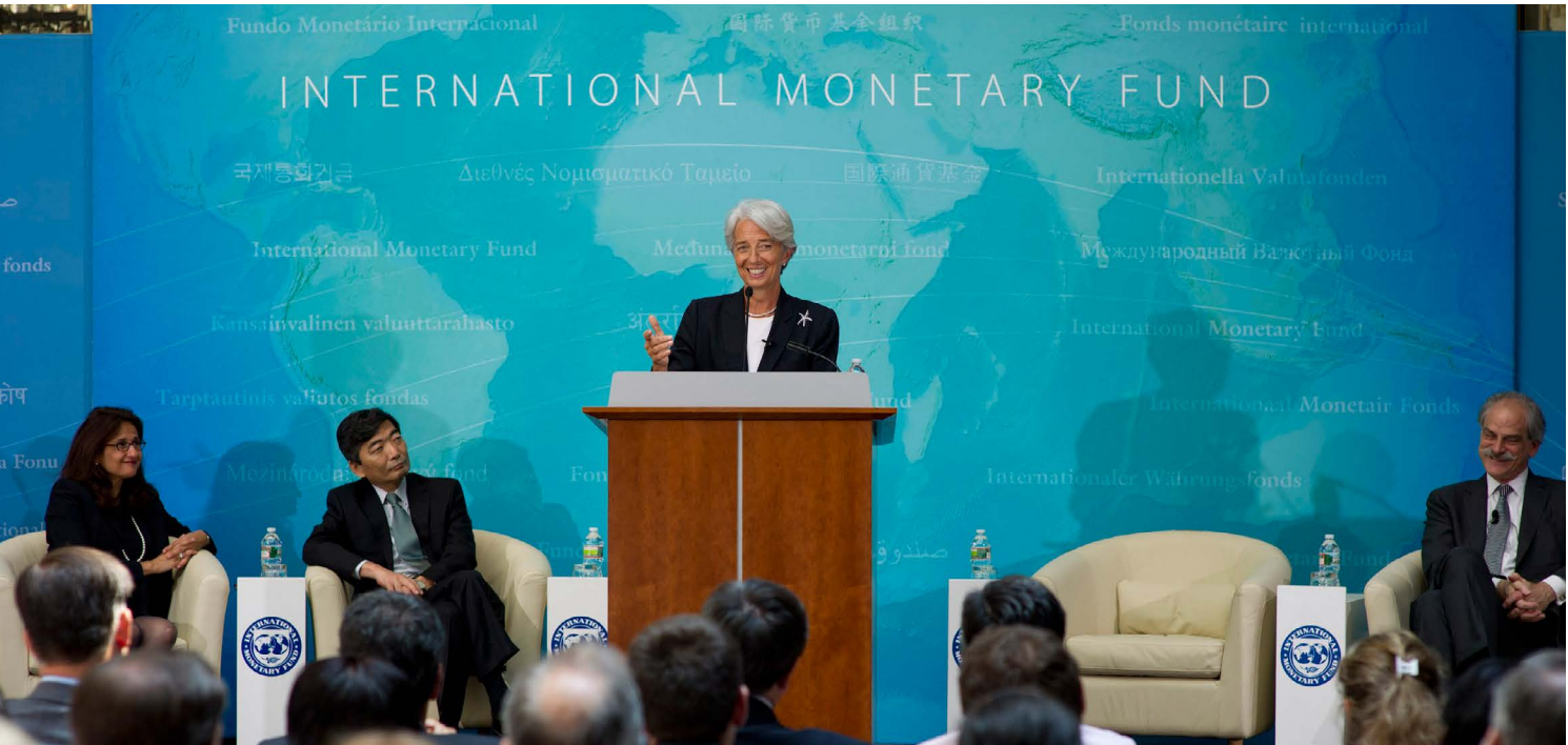
Cuba es uno de solo ocho países en el mundo que no son miembros del FMI, encabezado por Christine Lagarde. (Arriba)

lecciones para Cuba. Albania, que se incorporó al FMI en octubre de 1991, posee algunas similitudes interesantes. El primer préstamo que el Fondo le otorgó a Albania se aprobó en agosto de 1992. Su reinserción en el sistema financiero mundial y las reformas consecuentes produjeron mejoras significativas en la calidad de vida. Vietnam ofrece otro ejemplo positivo, esta vez con la adhesión a las IFI después de un período de reforma inicial. En ambos países, mejoró desde el PIB hasta indicadores sociales como la esperanza de vida al nacer. Tales experiencias internacionales satisfactorias pueden actuar en favor de los consensos en Cuba en relación a tal decisión.