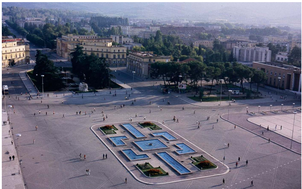
La plaza Skanderbeg en Tirana, la capital de Albania, se transformó significativamente desde 1988, a medida que Albania comenzaba a entrar en la economía global.

Cuando Albania se unió al FMI en octubre de 1991, no solo buscaba apoyo financiero sino también asistencia en el diseño de las reformas económicas. Para cumplir con los requisitos de adhesión al FMI, Albania tuvo que superar tres obstáculos: las debilidades de sus instituciones y base estadística; la