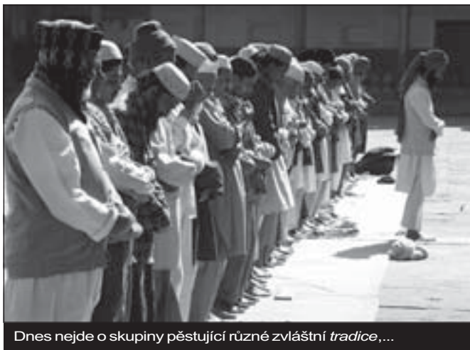
Dnes nejde o skupiny pěstující různé zvláštní tradice ,...

Třetí rozdíl spočívá v záměně hlavního terče xenofobie. Nejen že je odpor k cizímu převeden z judaismu a Židů na islám a Araby, ale láska k Židům a státu Izrael se stává hlavním kritériem loajality k Západu. Ještě ve třicátých letech by žádného etablovaného pravicového politika nenapadlo hovořit o obraně „judeokřesťanské civilizace“. Judaismus a Židé byli tradičními křesťanskými a pravicovými elitami evropských národů vylučováni jako Semité a Orientálci. Teprve šok z holocaustu, přesunutí značné části evropských přeživších Židů na Blízký východ a kritika křesťanského antijudaismu v hlavních proudech západního křesťanství otevřely možnost zahrnout judaismus a Židy do hranic pomyslné západní civilizace. Židé byli přijati až poté, co se vzdali